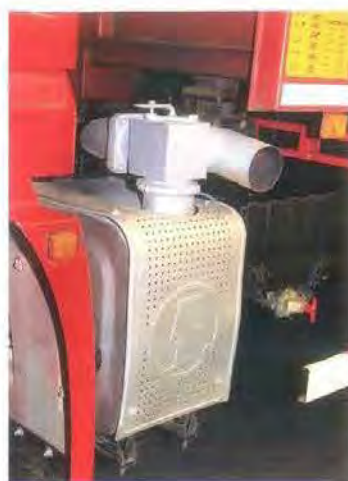
«Выхлоп направленного действия» — прямо в окна соседним легковушкам!