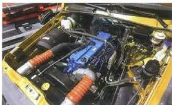
Под капотом – рядная «шестерка» ЯМЗ-536, причем на снимке – газодизельный вариант (он работает как на солярке, так и на смеси дизтоплива с метаном)

1 – рядный двигатель ЯМЗ-536, 2 – рулевой механизм RBL, 3 – коробка передач ZF, 4 – модернизированная раздаточная коробка, 5 – пневматическая тормозная система с компонентами Wabco, 6 – дополнительный топливный бак, 7 – кардан с торцевыми шлицами, 8 – модернизированные мосты с блокировкой межколесных дифференциалов, 9 – рама с антикоррозийным покрытием и цельным усилителем