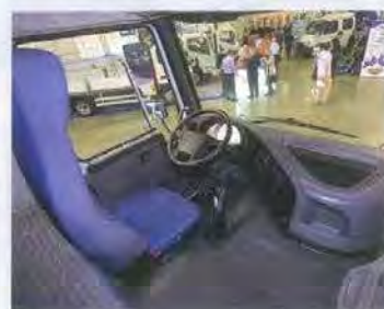
Интерьер от старого развозного Volvo FL и спальная полка шириной 61 см — не лучшее решение для тягача