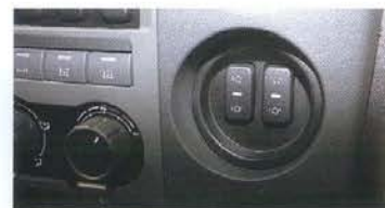
Справа в панель встроены кнопки централизованной подкачки шин. Далековато тянуться!