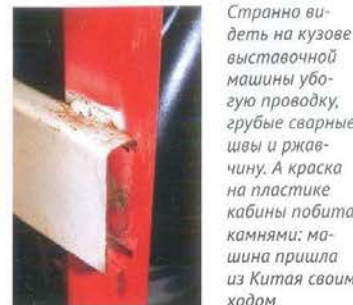
Странно видеть на кузове выставочной машины убогую проводку, грубые сварные швы и ржавчину. А краска на пластике кабины побита камнями; машина пришла из Китая своим ходом