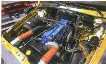
Под капотом – рядная «шестерка» ЯМЗ-536, причем на снимке – газодизельный вариант (он работает как на солярке, так и на смеси дизтоплива с метаном)

1 – рядный двигатель ЯМЗ-536, 2 – рулевой механизм RBL, 3 – коробка передач ZF, 4 – модернизированная раздаточная коробка, 5 – пневматическая тормозная система с компонентами Wabco, 6 – дополнительный топливный бак, 7 – кардан с торцевыми шлицами, 8 – модернизированные мосты с блокировкой межколесных дифференциалов, 9 – рама с антикоррозийным покрытием и цельным усилителем