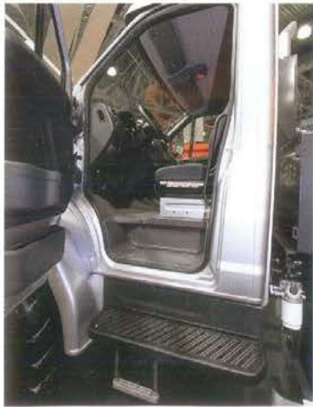
Широкая основная подножка и подвесная дополнительная – это отлично. Но поручни в дверных проемах дышат под весом человека