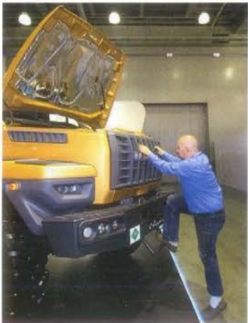
Чтобы забраться на бампер, надо ухватиться за ребра стеклопластиковой решетки. Правда, они жесткие, и за двумя из них – металлические усилители