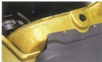
Невооруженным глазом видно, что металлические детали опенения еще сделаны «по обходным технологиям»

1 – рядный двигатель ЯМЗ-536, 2 – рулевой механизм RBL, 3 – коробка передач ZF, 4 – модернизированная раздаточная коробка, 5 – пневматическая тормозная система с компонентами Wabco, 6 – дополнительный топливный бак, 7 – кардан с торцевыми шлицами, 8 – модернизированные мосты с блокировкой межколесных дифференциалов, 9 – рама с антикоррозийным покрытием и цельным усилителем