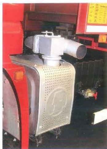
«Выхлоп направленного действия» — прямо в окна соседним легковушкам!