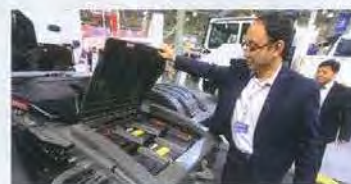
Аккумуляторы тягача Howo-V7G расположены, как у МАН, «в хвосте». А вот замки крышки аккумуляторного отсека ржавые

Марка Howo, известная у нас по самосвалам очень низкого качества (их тысячами завозили до кризиса 2008 года), возвращается с новыми моделями, в конструкции которых есть компоненты, сделанные по лицензии MAN. Сколько будут стоять у нас машины и кто их будет обслуживать — неизвестно: объединение Sinotruk, которому принадлежит марка, еще не определилось с тем, кто будет официально представлять Howo в России.