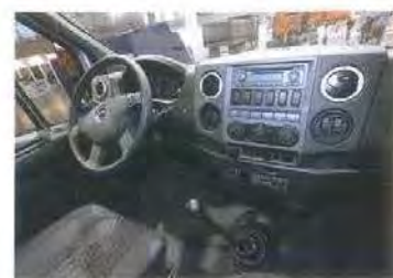
Интерьер, за исключением мелочей, — такой же, как у Газели Next

ское название «Урал Next E27»: ее грузоподъемность увеличится на 5 т, а полная масса — с 22,5 до 27 т. Кроме того, на Next E27 будут установлены (цитируем официальную презентацию) «новые узлы и агрегаты шасси совместно с партнером». Каким — пока не сообщается. Тем временем завод налаживает отношения с китайской фирмой Weiben (бывшая Beifang Benchi): по нашим сведениям, на завод уже поступили кабины Weiben для перспективных бескапотных моделей.