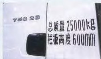
У грузовика Howo-T5G — «мановская» кабина, неплохой интерьер, даже «мановский» шрифт индекса на дверях... И размазанные надписи краской по трафарету!

Марка Howo, известная у нас по самосвалам очень низкого качества (их тысячами завозили до кризиса 2008 года), возвращается с новыми моделями, в конструкции которых есть компоненты, сделанные по лицензии MAN. Сколько будут стоять у нас машины и кто их будет обслуживать — неизвестно: объединение Sinotruk, которому принадлежит марка, еще не определилось с тем, кто будет официально представлять Howo в России.