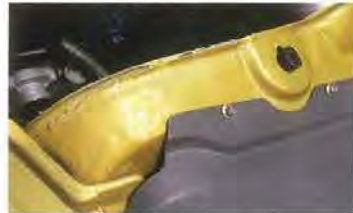
Невооруженным глазом видно, что металлические детали оперения еще сделаны «по обходным технологиям»

1 – рядный двигатель ЯМЗ-536, 2 – рулевой механизм RBL, 3 – коробка передач ZF, 4 – модернизированная раздаточная коробка, 5 – пневматическая тормозная система с компонентами Wabco, 6 – дополнительный топливный бак, 7 – кардан с торцевыми шлицами, 8 – модернизированные мосты с блокировкой межколесных дифференциалов, 9 – рама с антикоррозийным покрытием и цельным усилителем