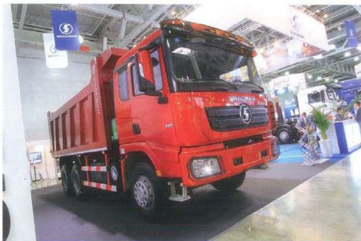
Shastan (он же Shaanxi) привез новинку — самосвал X3000, который должен заметить у нас предшественников после введения норм Евро-5. В отличие от привычных самосвалов Shastan, кабина сделана уже не по лицензии MAN, а ряд решений удивил...