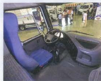
Интерьер от старого развозного Volvo FL и спальная полка шириной 61 см — не лучшее решение для тягача