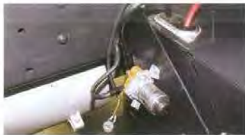
Кнопка выключения «массы» с торчащими проводами явно установлена наспех