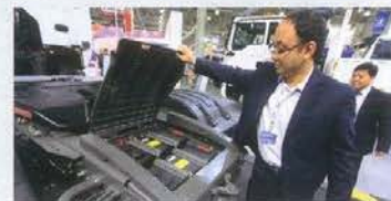
Аккумуляторы тягача Nowo-V7G расположены, как у МАН, «в хвосте». А вот замки крышки аккумуляторного отсека ржавые

Марка Nowo, известная у нас по самосвалам очень низкого качества (их тысячами завозили до кризиса 2008 года), возвращается с новыми моделями, в конструкции которых есть компоненты, сделанные по лицензии MAN. Сколько будут стоять у нас машины и кто их будет обслуживать — неизвестно: объединение Sinotruk, которому принадлежит марка, еще не определилось с тем, кто будет официально представлять Nowo в России.