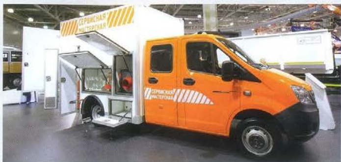
Среди интересных экспонатов на стенде Группы ГАЗ – «аварийка» для бригады из шести человек с гидравлической станцией и гидроинструментом. Изготовитель – фирма Динрус из Санкт-Петербурга, цена с оборудованием – 5,5 млн рублей