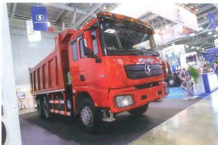
Шастап (он же Шаапхи) привез новинку — самосвал X3000, который должен заметить у нас предшественников после введения норм Евро-5. В отличие от привычных самосвалов Шастап, кабина сделана уже не по лицензии MAN, а ряд решений удивил...