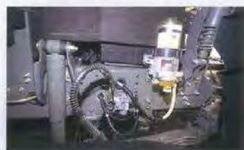
Топливный фильтр-«сепар» расположен над передним колесом, в нише, куда будет лететь вся грязь. Ну и ну!