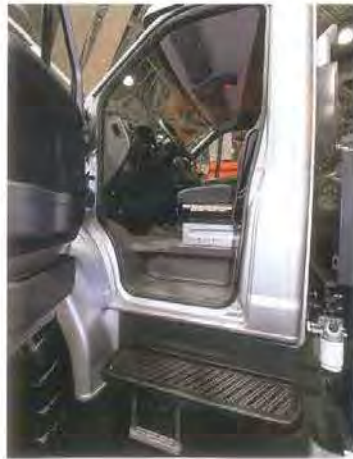
Широкая основная подножка и подвесная дополнительная – это отлично. Но поручни в дверных проемах дышат под весом человека