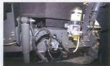
Топливный фильтр-«сепар» расположен над передним колесом, в нише, куда будет лететь вся грязь. Ну и ну!