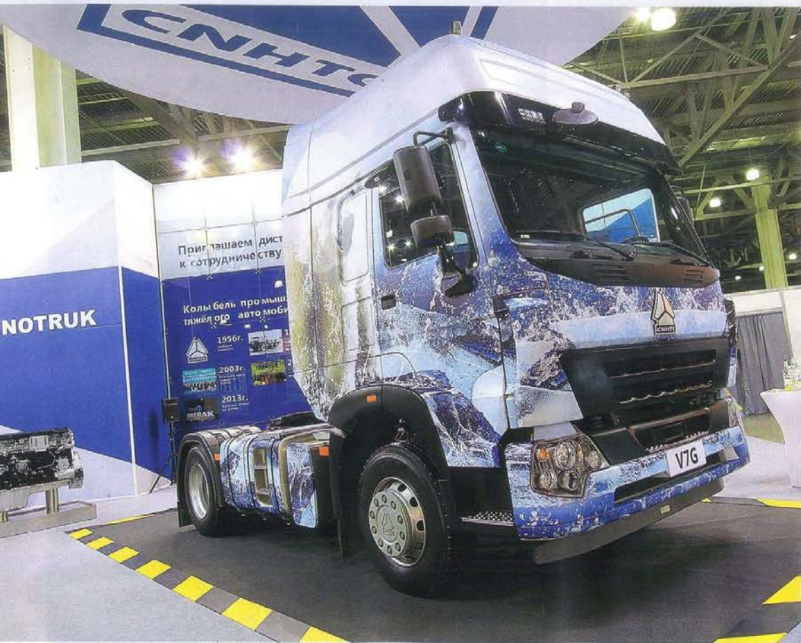
Nowo-V7G — первый двухосный тягач европейского образца из Китая, который мы видим! Но что здесь за кабина? Сейчас объединение Sinotruk выпускает тягачи Sitrak (с лицензионной кабиной MAN TGA), Nowo-A7 (с лицензионной кабиной Volvo FH)... А кабина этой модели — как у знакомых нам самосвалов Nowo (от старой модели Volvo FL), но с высокой крышей и облицовкой «как у Nowo-A7». Двигатель сделан по лицензии MAN, топливный бак со встроенными ступеньками — тоже «как у МАН», а седло — Iost из Германии