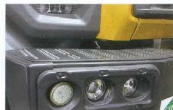
Светотехника — OSVAP и Hella, в том числе на светодиодах