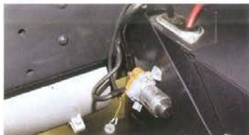
Кнопка выключения «массы» с торчащими проводами явно установлена наспех