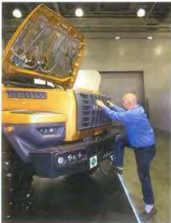
Чтобы забраться на бампер, надо ухватиться за ребра стеклопластиковой решетки. Правда, они жесткие, и за двумя из них – металлические усилители