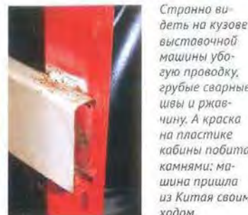
Странно видеть на кузове выставочной машины убогую проводку, грубые сварные швы и ржавчину. А краска на пластике кабины побита камнями: машина пришла из Китая своим ходом