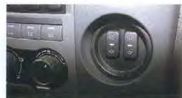
Справа в панель встроены кнопки централизованной подкачки шин. Далековато тянуться!