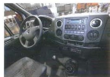
Интерьер, за исключением мелочей, — такой же, как у Газели Next

ское название «Урал Next E27»: ее грузоподъемность увеличится на 5 т, а полная масса — с 22,5 до 27 т. Кроме того, на Next E27 будут установлены (цитируем официальную презентацию) «новые узлы и агрегаты шасси совместно с партнером». Каким — пока не сообщается. Тем временем завод налаживает отношения с китайской фирмой Weiben (бывшая Beifang Benchi): по нашим сведениям, на завод уже поступили кабины Weiben для перспективных бескапотных моделей.