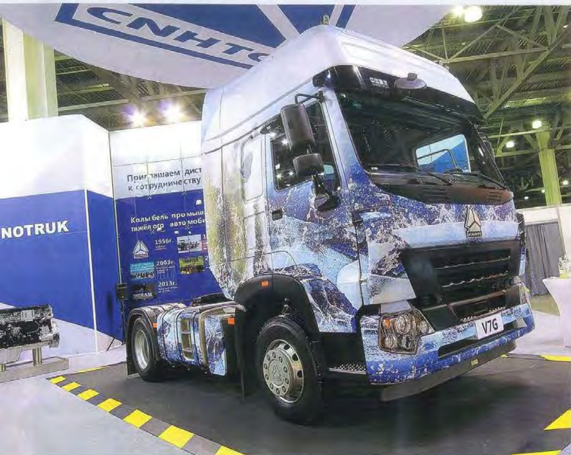
Howo-V7G — первый двухосный тягач европейского образца из Китая, который мы видим! Но что здесь за кабина? Сейчас объединение Sinotruk выпускает тягачи Sitrak (с лицензионной кабиной MAN TGA), Howo-A7 (с лицензионной кабиной Volvo FH)... А кабина этой модели — как у знакомых нам самосвалов Howo (от старой модели Volvo FL), но с высокой крышей и облицовкой «как у Howo-A7». Двигатель сделан по лицензии MAN, топливный бак со встроенными ступеньками — тоже «как у МАН», а седло — Jost из Германии