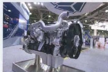
Sinotruk купил лицензии на производство двигателей MAN D08, D20 и D26. Но заявленному интервалу смены масла, раз в 100 тысяч км, — не верим