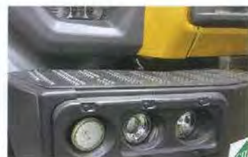
Светотехника — OSVAP и Hella, в том числе на светодиодах