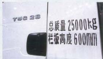
У грузовика Nowo-T5G — «мановская» кабина, неплохой интерьер, даже «мановский» шрифт индекса на дверях... И размазанные надписи краской по трафарету!

Марка Nowo, известная у нас по самосвалам очень низкого качества (их тысячами завозили до кризиса 2008 года), возвращается с новыми моделями, в конструкции которых есть компоненты, сделанные по лицензии MAN. Сколько будут стоять у нас машины и кто их будет обслуживать — неизвестно: объединение Sinotruk, которому принадлежит марка, еще не определилось с тем, кто будет официально представлять Nowo в России.