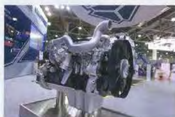
Sinotruk купил лицензии на производство двигателей MAN D08, D20 и D26. Но заявленному интервалу смены масла, раз в 100 тысяч км, — не верим