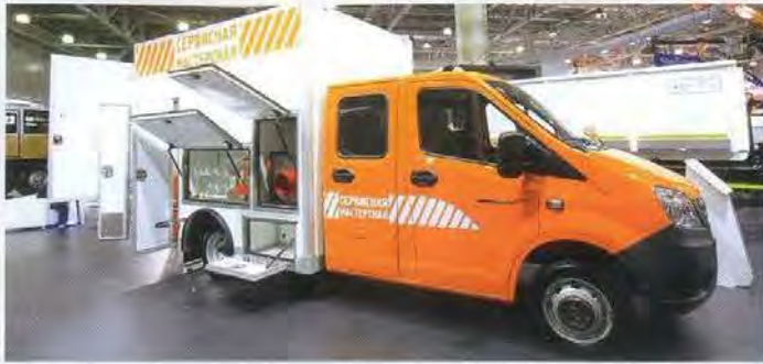
Среди интересных экспонатов на стенде Группы ГАЗ – «аварийка» для бригады из шести человек с гидравлической станцией и гидроинструментом. Изготовитель – фирма Динрус из Санкт-Петербурга, цена с оборудованием – 5,5 млн рублей